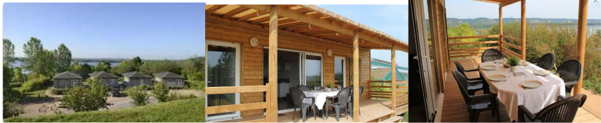
Chalets et cottages

Les draps de lits sont fournis ainsi qu'un drap bain